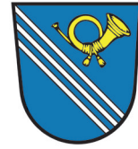
Gemeinde Saal a. d. Donau